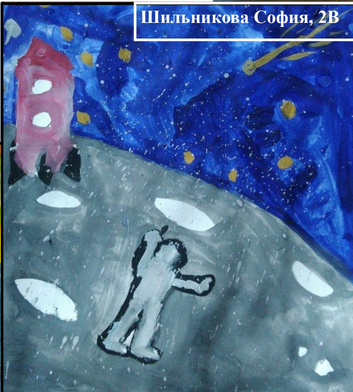
Шильникова София, 2В