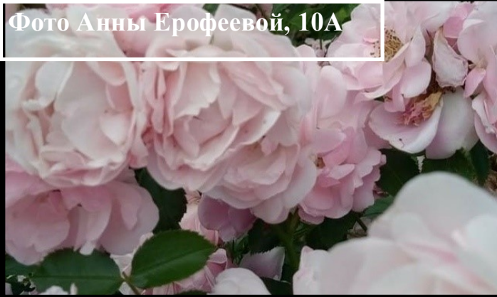
Фото Анны Ерофеевой, 10А

Весна — слово всего из пяти букв, но в нем так много веры.