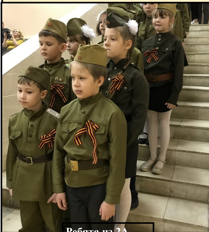
Ребята из 2А